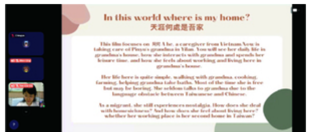
開幕式當天，各組對於自己拍攝的紀錄短片進行簡介